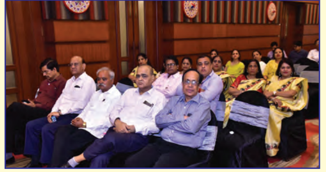
गुवाहाटी एवं अन्य शाखाओं के अभिनंदन समारोह में उपस्थित सम्मेलन के सदस्यगण