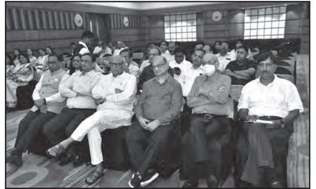
गुवाहाटी में आयोजित अभिनंदन समारोह एवं उपस्थित गणमान्य समाजगण