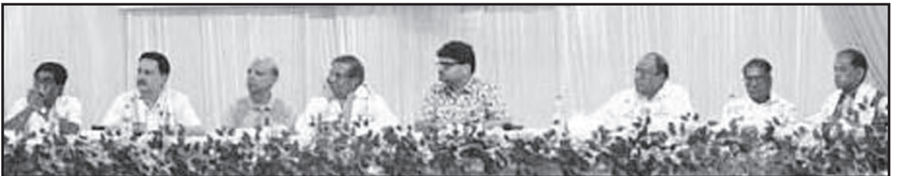
नगाँव में सभा मंच पर उपस्थित पदाधिकारीगण

अखिल भारतवर्षीय मारवाड़ी सम्मेलन के राष्ट्रीय अध्यक्ष गोवर्धन प्रसाद गाड़ोदिया व अन्य पदाधिकारियों के पूर्वोत्तर दौरे की कड़ी में मारवाड़ी सम्मेलन नगाँव शाखा की एक सभा का आयोजन