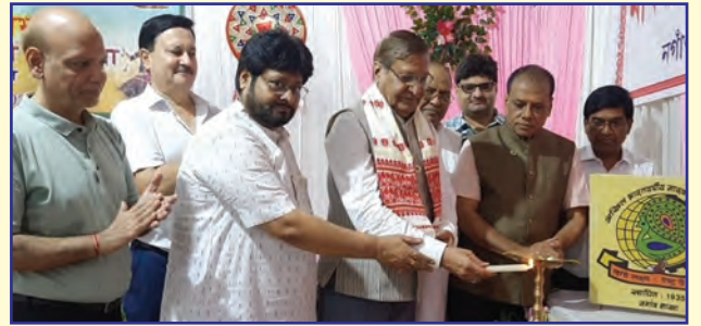
पूर्वोत्तर प्रांत की नगाँव शाखा में राष्ट्रीय, प्रांतीय एवं शाखा के पदाधिकारियों द्वारा दीप प्रज्वलन