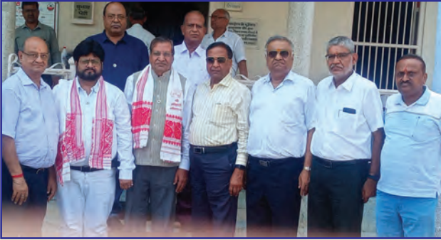
गौशाला में स्थानीय पदाधिकारियों एवं समाज बंधुओं के साथ