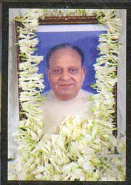
राष्ट्रीय उपाध्यक्ष बदीप्रसाद भीमसरिया का देहावसान